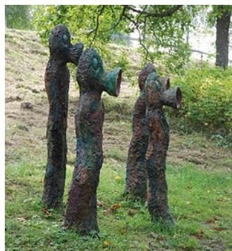
Entonnoir vieillards dans le parc de sculptures Ängelsberg